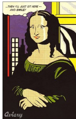
à la manière de Roy Lichtenstein