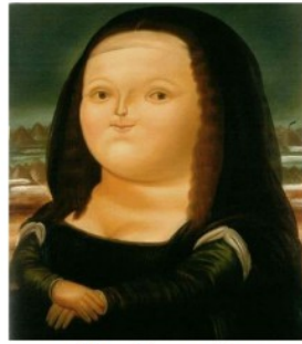
Mona Lisa, de Botero