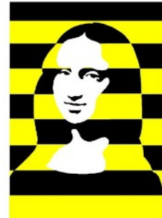
Mona VIII, de Holger Löwig