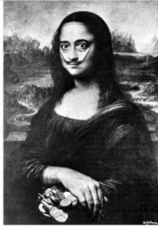
Autoportrait en Mona Lisa, de Dalí