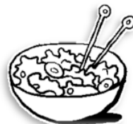
La salade de légumes