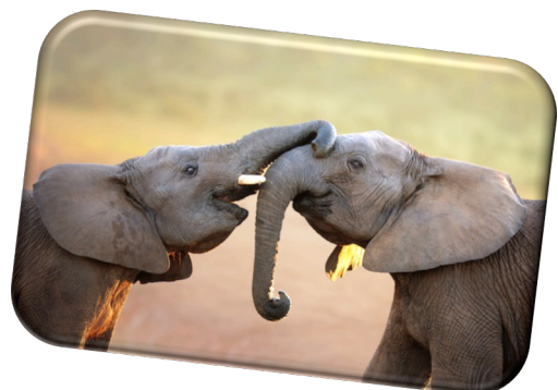
L'éléphant barrit !