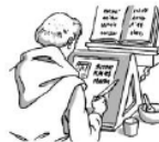
Les moines copistes recopient les textes .

Avec l'invention de l'imprimerie, les livres manuscrits vont peu à peu disparaître.