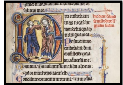
Une page de livre illustrée

Avec l'invention de l'imprimerie, les livres manuscrits vont peu à peu disparaître.