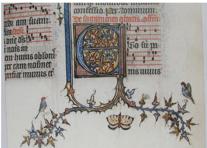
Lettrine ornée avec développements