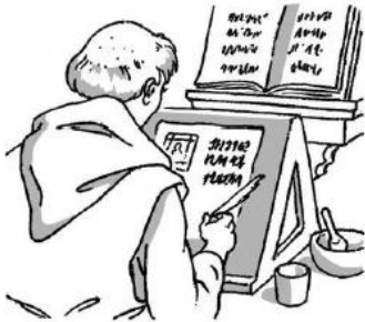
Un moine copiste.

Au Moyen-âge, l'imprimerie n'existait pas encore. Les moines recopiaient des livres à la main : ce sont des manuscrits . Les livres étaient rares car les moines mettaient des années à les fabriquer. Chaque livre était unique et richement décoré avec des lettrines et des enluminures .