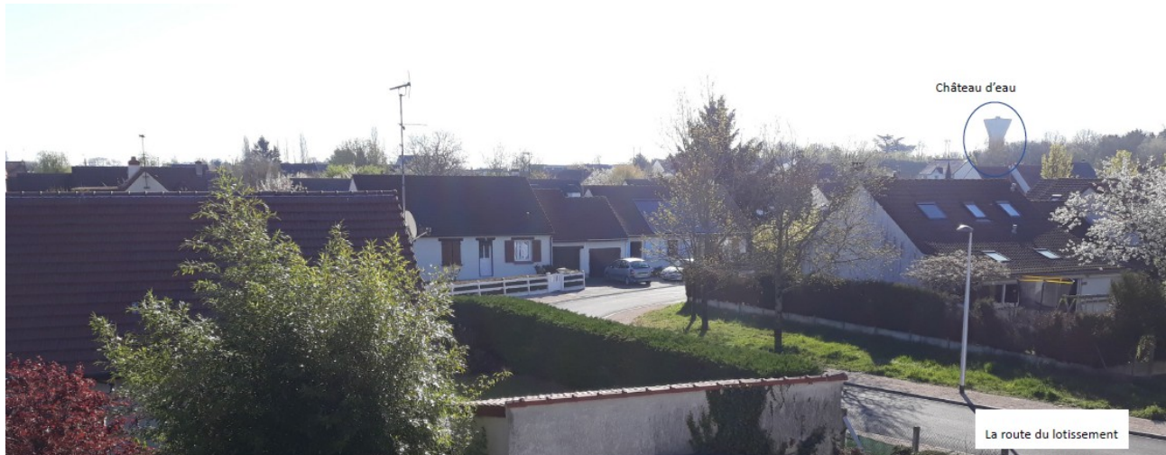
Je vois des maisons individuelles ,de l'herbe ,des arbres , des jardins , des lampadaires , des voitures.