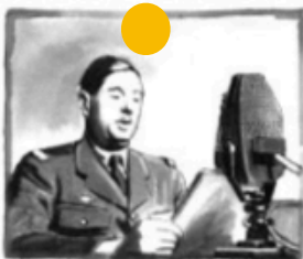
Général de Gaulle

C'est librement que je me suis rendu à l'invitation du Führer . Je n'ai subi de sa part aucune pression. Une collaboration a été envisagée entre nos deux pays. J'en ai accepté le principe. Ainsi, dans un avenir proche, pourrait être allégé le poids des souffrances de notre pays. L'armistice, au demeurant, n'est pas la paix. La France est tenue par ses obligations nombreuses vis-à-vis du vainqueur. Cette politique est la mienne. Suivez-moi. Gardez votre confiance en la France éternelle.