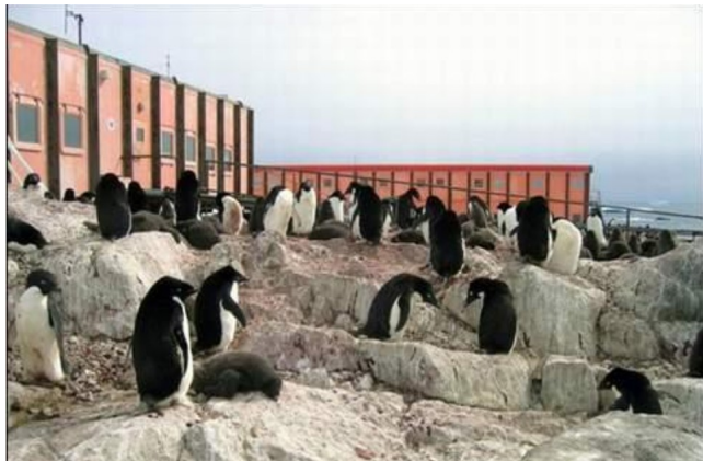
Base scientifique de la Terre Adélie