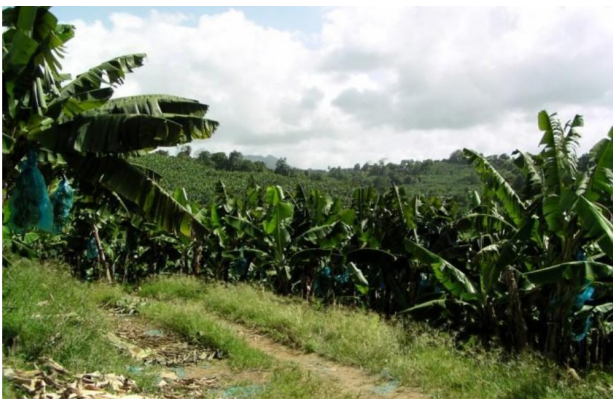
Plantation de bananes en Martinique

La différence des territoires d'outre- mer zone chaude (près de l'équateur) : les cultures différentes , les richesses du sol et le tourisme avec les vacanciers