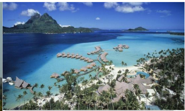
Station touristique en Polynésie