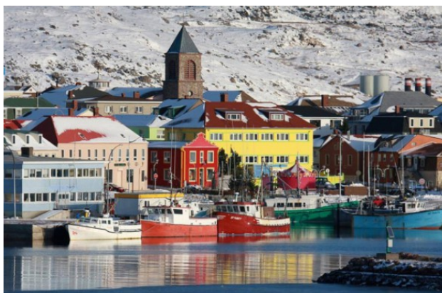
Pêche à Saint Pierre et Miquelon

5) Complète le résumé avec les mots suivants.