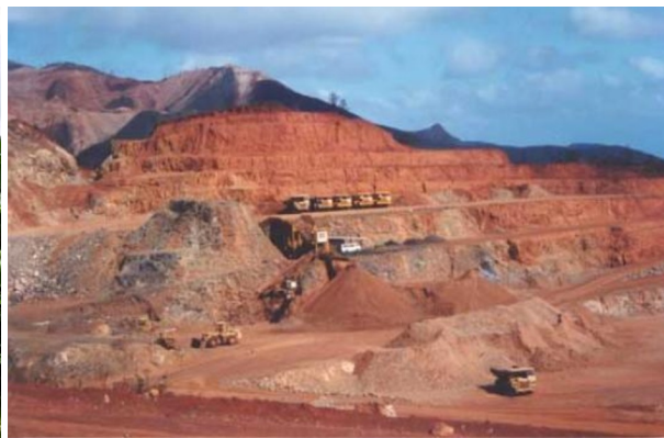
Mine en Nouvelle - Calédonie