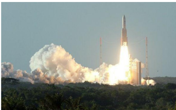
Lancement de la fusée Ariane en Guyane