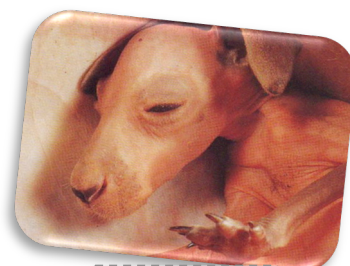
À 1 mois