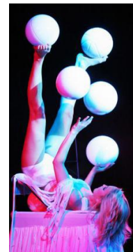
Une jongleuse antipodiste