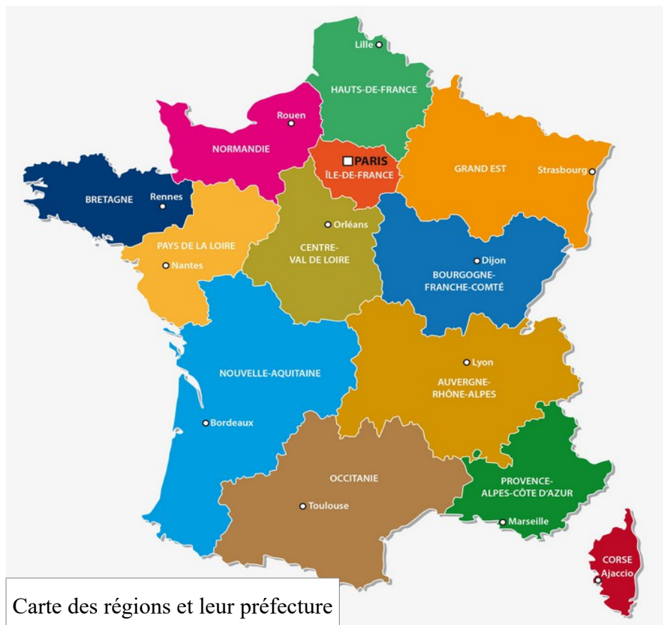
Carte des régions et leur préfecture

5) Observe la carte des régions ci-dessous et réponds :