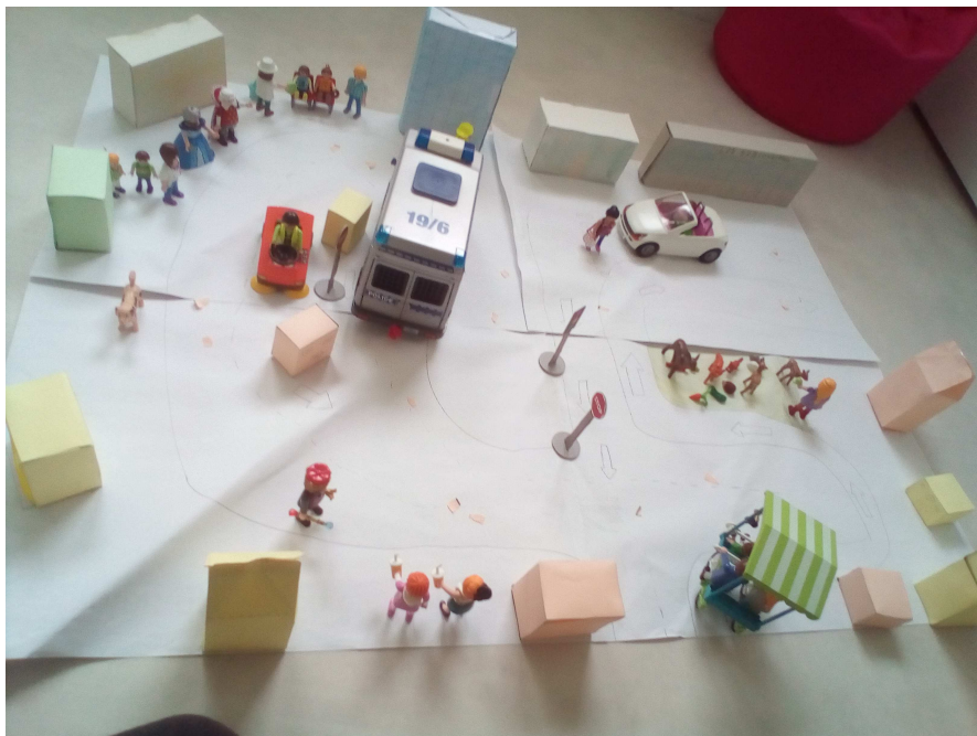
Anthéa (ma ville)