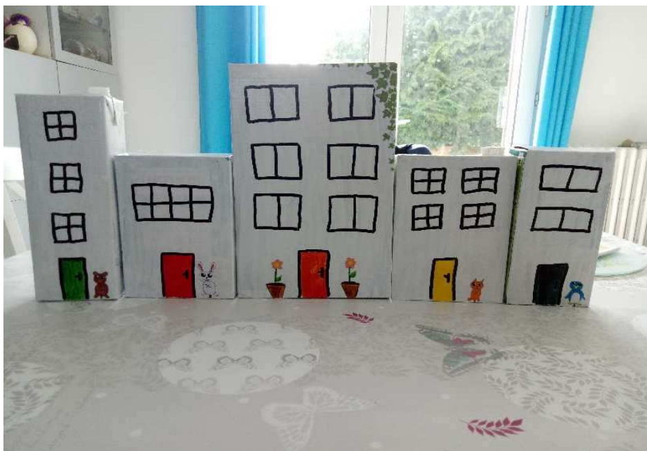
Louise (ma ville)