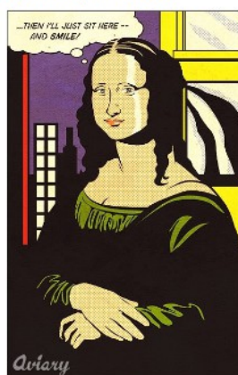
à la manière de Roy Lichtenstein