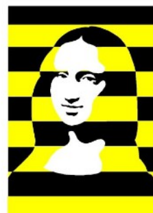
Mona VIII, de Holger Matthies