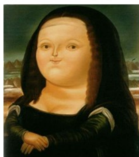
Mona Lisa, de Botero