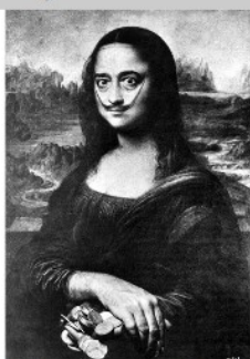
Autoportrait en Mona Lisa, de Dalí