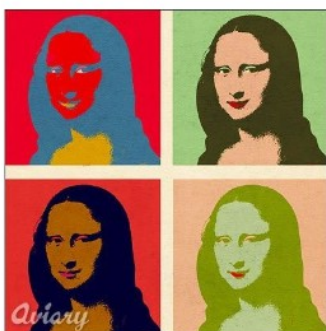
à la manière d'Andy Warhol