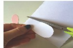
Et des blanches, plus grandes