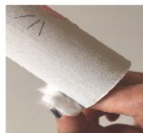
Puis coller-le derrière le rouleau