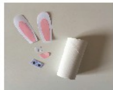
Puis coller les éléments sur le rouleau: