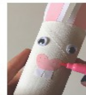
Tracez des points sur le nez