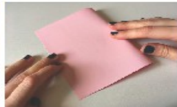
Plier le papier rose en deux