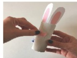
Le nez et les dents