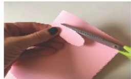
Découper des oreilles roses