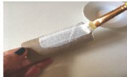
Peindre le rouleau de papier toilette