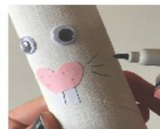
Puis des moustaches en gris