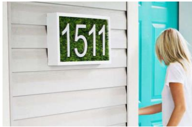
numéro de maison