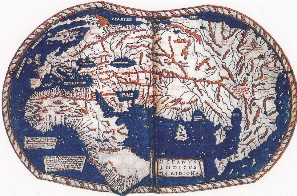
À l'assaut des mers Carte de 1489