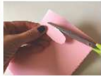
Découper des oreilles roses