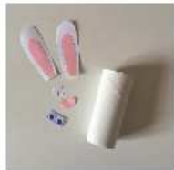
Puis coller les éléments sur le rouleau: