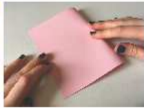
Plier le papier rose en deux