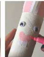
Tracez des points sur le nez