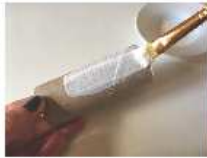
Peindre le rouleau de papier toilette