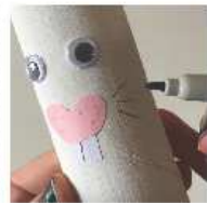
Puis des moustaches en gris