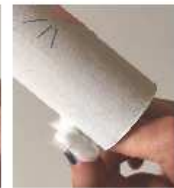
Puis coller-le derrière le rouleau