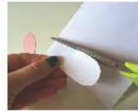
Et des blanches, plus grandes