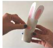
Le nez et les dents