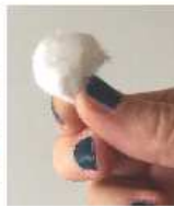
Prendre un coton et tenez-le en boule